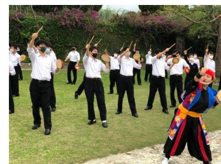
おきなわワールド