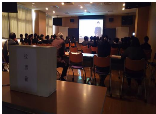
視聴覚教室で区長候補（生徒）の政見放送