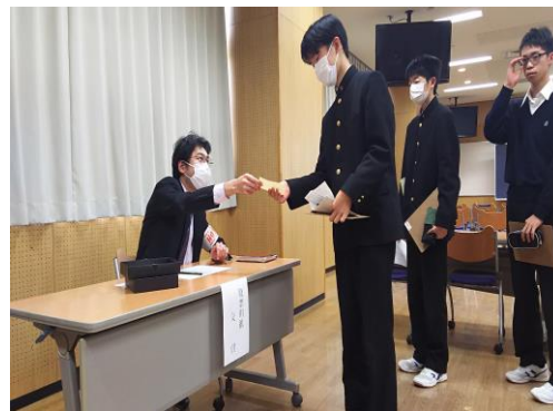
投票用紙の交付です