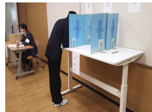
投票記載台で投票用紙に党名・候補者を記入します