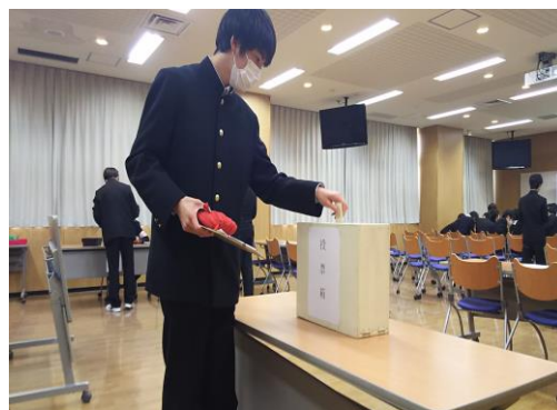
投票箱に投票用紙を入れました

平成30年2月26日に開催された選挙管理委員会において、平成30年3月1日の任期満了に伴う、新宿区長選挙模擬選挙の選挙期日を平成30年2月28日投開票（同月27日日告示）と決定したものです。